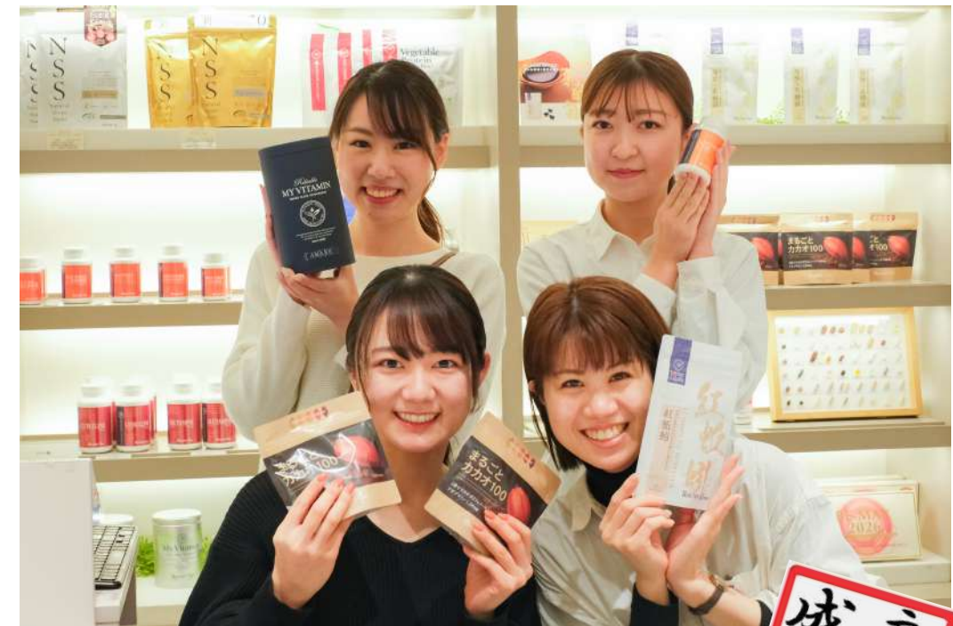
ご入社、お待ちしております！（社員一同）